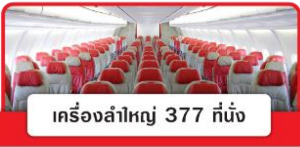
เครื่องลำใหญ่ 377 ที่นั่ง

**หมายเหตุ** เคาน์เตอร์เช็คอินจะปิดบริการก่อนเวลาเครื่องออกอย่างน้อย 60 นาที และผู้โดยสารพร้อม ฒ ประตูขึ้นเครื่องก่อนเวลาเครื่องออก 40 นาที (**ขอสงวนสิทธิ์ในการเลือกที่นั่งบนเครื่อง เนื่องจากต้องเป็นไปตามระบบของสายการบิน**)