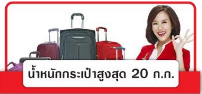
น้ำหนักกระเป๋าสูงสุด 20 ก.ก.

08.05 น. บินลัดฟ้าสู่ สาธารณรัฐเกาหลีใต้ โดยเที่ยวบินที่ XJ708 (ไม่มีบริการอาหารบนเครื่อง)